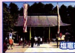
塩竈市・鹽竈神社