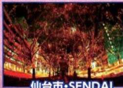
仙台市・SENDAI 光のページェント