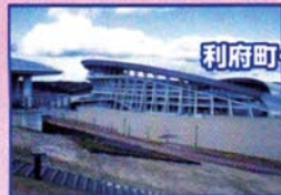
利府町・グランディ21