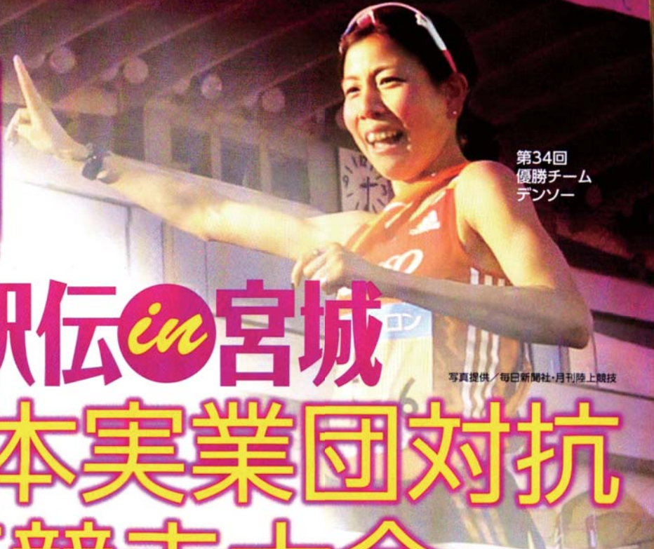
第34回 優勝チーム デンソー