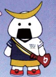
仙台・宮城観光PRキャラクター むすび丸