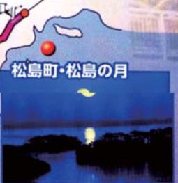
松島町・松島の月